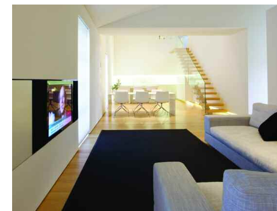
OPEN SPACE L'ambiente principale è caratterizzato dalla scala con gradini di legno aperti a sbalzo.

«È fondamentale. Bisogna sempre aprire il più possibile gli spazi verso l'esterno per catturare la luce, che, dalla mattina alla sera, con le varie esposizioni, fa cambiare l'intera