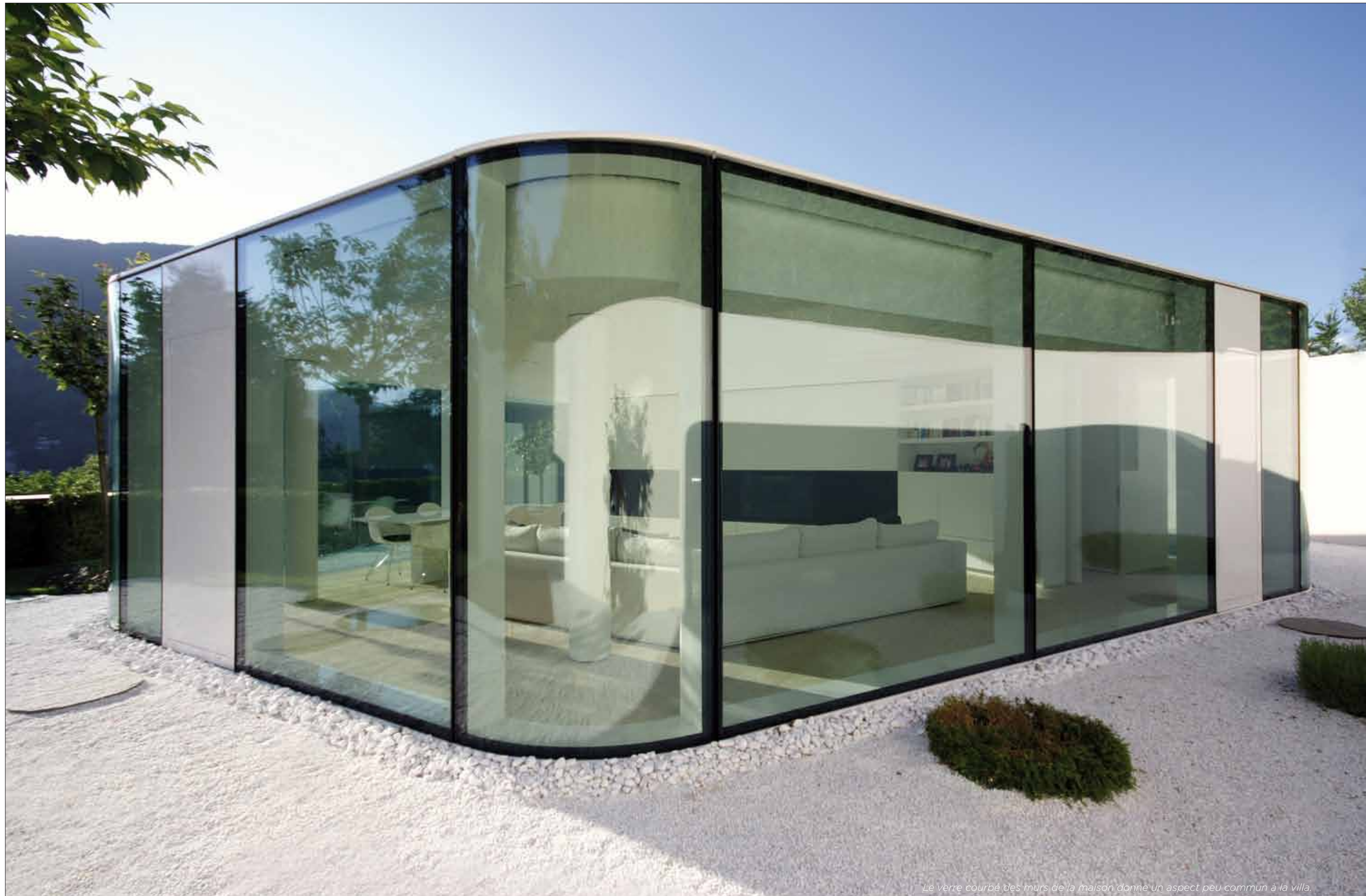
Le verre courbé des murs de la maison donne un aspect peu commun à la villa.

C'est au bord du lac Lugano en Suisse, que l'architecte milanais Jacopo Mascheroni a construit une villa aux contours surprenants. Une villa sur deux étages qui s'encastre dans la montagne. Un jeu de formes et matières qui donnent une identité belle et forte à la Villa du Lac Lugano.